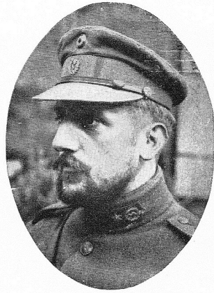
VAUME, Renier, né le 2 janvier 1886, à Chênée.

Officier du service de santé, se dévoua sans compter sur les Champs de Bataille d'Afrique. Terrassé par la maladie, mourut, à Cerigola, le 11 avril 1918.